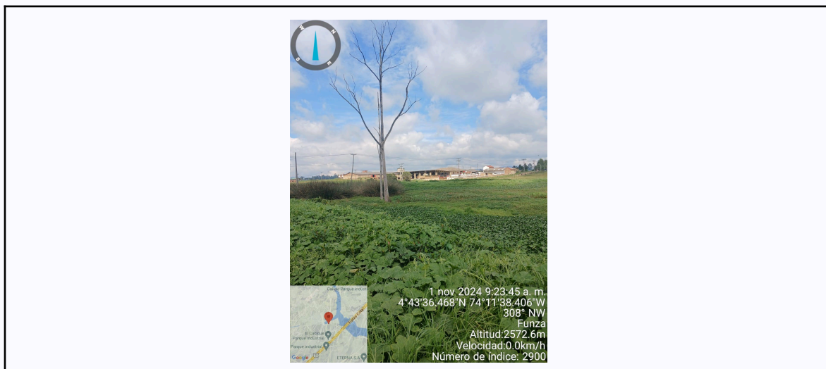
Ilustración 2. Recorrido de control y vigilancia ronda del humedal Gualí N° 7

C.P 250020 Tel. (601) 8234070 823 40 71 / 823 40 73 Fax. (601) 8257620 Dir., Cra. 14 No. 13-05 03-FR-17 VER.10.2024